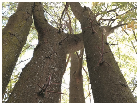
ritidoma e espinhos