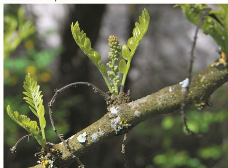
ramo com cacho jovem ereto e cacho velho pendente