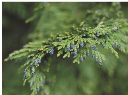
ramos aplanados horizontais e flores masculinas

semente largamente aladas com tegumento coriáceo com resina, 2-5 sementes por escama fértil do gábulos.