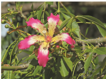
flor, gomos e folhas

sementes muitas envolvidas por fibras sedosas brancas, a que dá o nome de paina ou sumaúma.