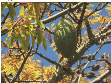
fruto e ramos (com acúleos)

Floração: set-nov. Frutificação: jul-ago.