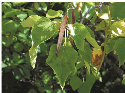
aspecto das folhas simples e das cápsulas tubulares