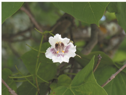
aspecto da flor branca com marcas purpúreas

Localização no PBTA: Parcela 03, Parcela 10, Parcela 12.