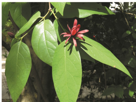
folhas opostas e flores