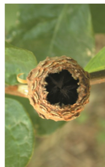
aquénios no interior do recetáculo