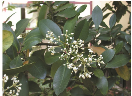
aspecto das folhas e das flores