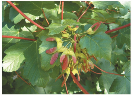
dissâmara ou samarídios

Floração: abr.-mai. Frutificação: set.-out.