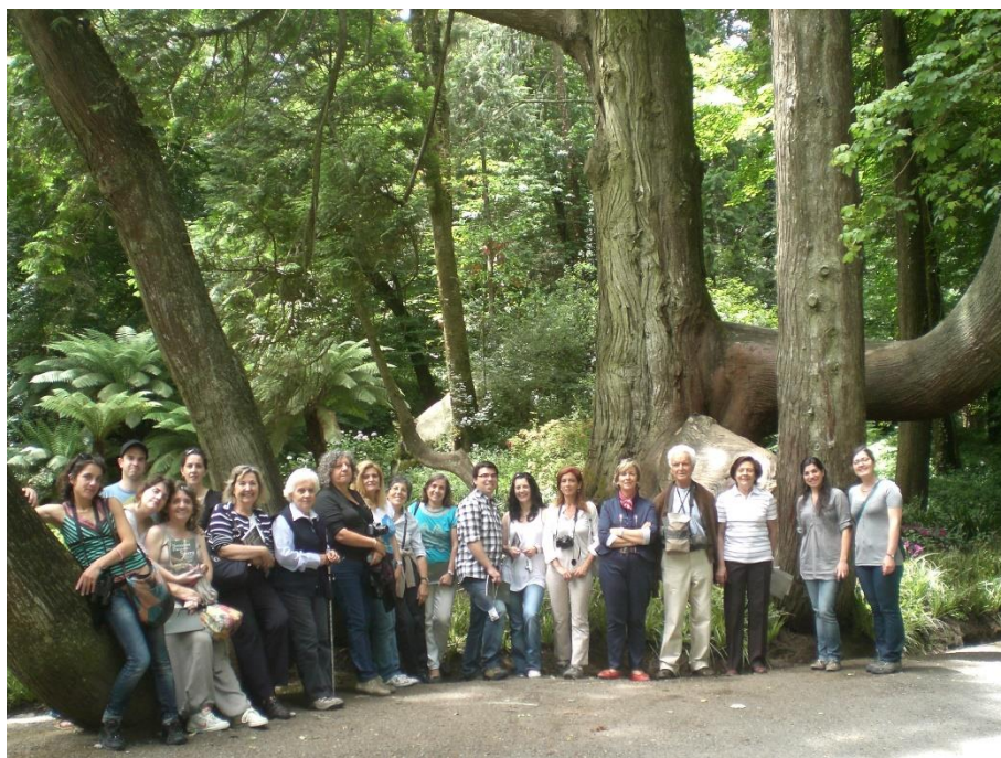
Visita, em 2012, pelos “Percursos Botânicos” do Parque da Pena, em Sintra

A partir de 1976 dedicou-se também ao estudo da bioecologia de infestantes vindo a publicar o "Manual para a Identificação de Plântulas de Infestantes" (1ª edição, 1978; 2ª edição, 1980 e reimpressão em 1984; 3ª edição em 2001). Em 1986, é coautora do livro «Mauvaises Herbes des Vergers et Vignes de l'Ouest du Bassin Méditerranéen», traduzido no mesmo ano para português, e intitulado “Ervas daninhas das vinhas e pomares”; uma 2ª edição é publicada em 2000. Em 1995, é também coautora da publicação digital "An Hypermedia System for Plant Protection" (HYPP), base de dados que consistiu na descrição e digitalização da imagem das principais infestantes da Europa ocidental no estado de plântula e de planta adulta, com a finalidade de se proceder à identificação de 580 espécies. O estudo iniciado em 2003, sobre espécies forrageiras, continua a ser desenvolvido, tendo sido já publicado, em 2015, em coautoria, o livro «Trevos, Anafes e Luzernas de Portugal – Estudo das Formas Juvenis, Floração e Frutificação».