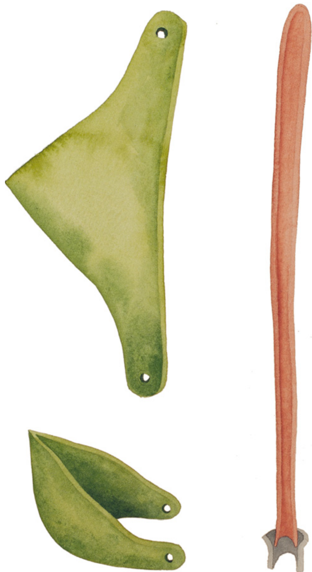
Dubitatio binata THECACEAE