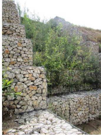
Fig. 6. Gabiões vivos do 3º pano de talude, maio de 2015

entanto, as estacas instaladas nas laterais dos gabiões no final de julho morreram (em cerca de 95%), mesmo com o suporte de rega gota-a-gota durante o período mais seco.