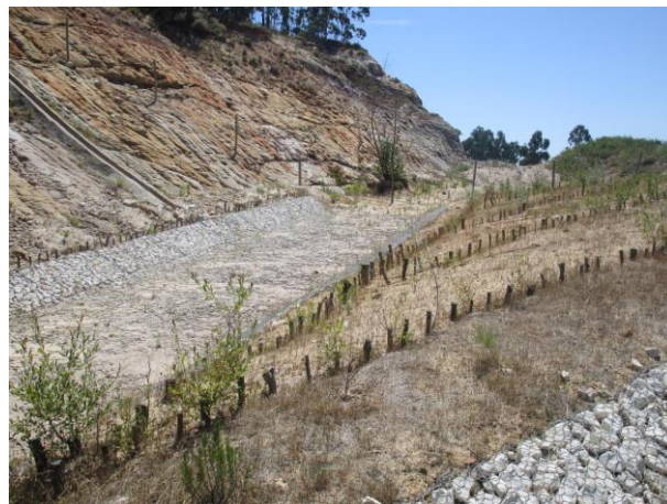
Fig. 9. Pentes vivos e colchão vivo, junho de 2015

Nestas técnicas foram colocadas estacas, com o objetivo de facilitar o reencaminhamento das águas e proporcionar a consolidação do terreno, através do crescimento das raízes infiltradas por baixo dos colchões. Contudo estas implementações ocorreram no final de julho, e tal como as estacas nas laterais dos gabiões, ainda que regadas até setembro, morreram na sua maioria (Figura 9). Apenas algumas estacas se mantiveram vivas até ao final da época de crescimento, provavelmente devido à presença de água suspensa nos estratos geológicos que ocorrem.