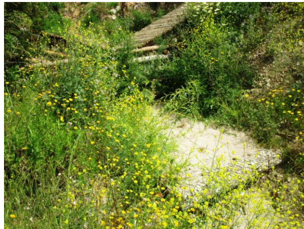
Fig. 7. Degraus de pedra e madeira, maio de 2015

Esta técnica foi instalada em julho, verificando-se a sua eficiência técnica e o enraizamento das estacas (Figura 7), na consolidação das estruturas e na consolidação do canal de escoamento.