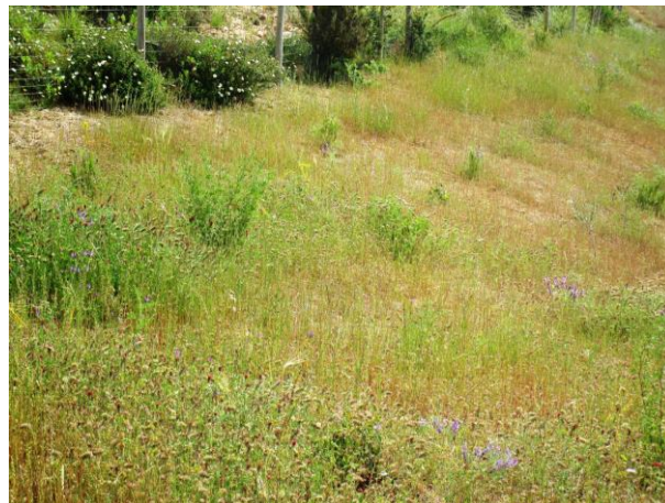
Fig. 5. Sementeira com cobertura de proteção de palha e plantação de arbustos, pormenor do lado Norte, maio de 2015

Nas áreas superiores do talude, com menor pendente, a reconstrução da cobertura vegetal com a plantação de arbustos e sementeira com cobertura de palha foi um sucesso (Figura 5). O tapete denso de herbáceas e arbustos emoldura o talude. Observando o estado das herbáceas, deduz-se que a “poda” realizada pelos coelhos-bravos, que ali pastam, estimulou a produção de maior quantidade de raízes e de rebentos; os excrementos de coelho contribuem de igual modo para o aumento de matéria orgânica do solo. À semelhança do anterior, com esta técnica obteve-se um dos resultados melhores do projeto.