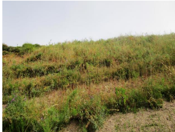
Fig. 4. Faixas de vegetação, maio de 2015

presas na linha de arbustos e contribuíram neste sentido para criar densas barreiras verdes (Figura 4). A aplicação desta técnica foi muito satisfatória. A plantação, realizada em julho, num solo desprovido de húmus, provou a sua efetividade e capacidade de “reciclar” as sementes da hidrossementeira entre as faixas. Com esta técnica obteve-se um dos melhores resultados do projeto.