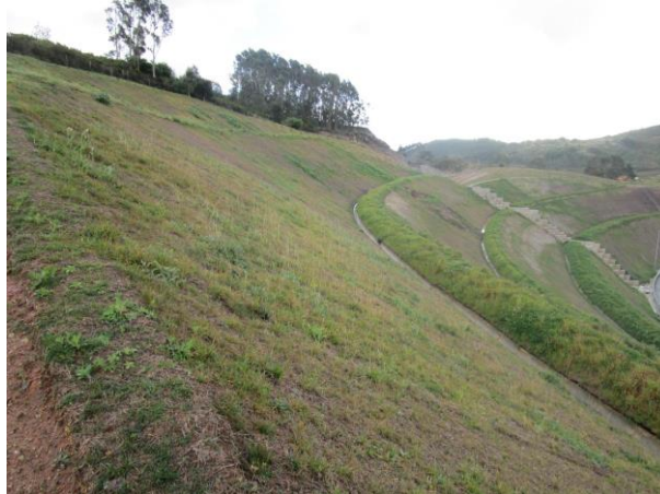
Fig. 2. Sementeira com palha e cobertura de esteira de palha, 4º e 5º panos de talude, janeiro de 2015

Estes problemas conduziram a uma colonização dispersa dominada por espécies de gramíneas, em 40% da área de superfície intervencionada. Os outros 60% da área foram cobertos por vegetação muito densa composta quer por espécies de leguminosas quer de gramíneas.