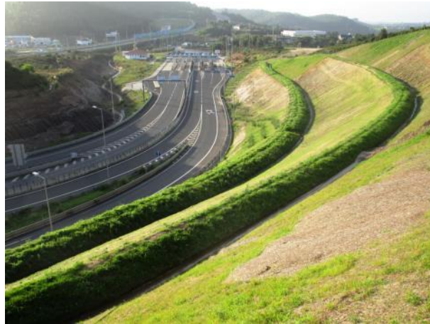
Fig. 8. Banqueta viva “a Portuguesa” novembro 2014