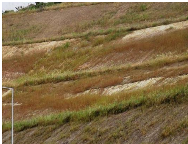
Fig. 3. Panorâmica da hidrossementeira, 2º e 3º panos de talude, maio de 2015

No período decorrido entre o reperfilamento do talude (abril e maio) e a realização da hidrossementeira (dezembro), as chuvas do Outono ravinaram a superfície do talude, desprovida de vegetação. A primeira hidrossementeira, em outubro de 2014, não teve sucesso algum devido às chuvas intensas ocorridas imediatamente após a sua execução, que lavaram as fibras de suporte bem como as sementes. A segunda hidrossementeira, realizada em dezembro de 2014, produziu desde março uma cobertura herbácea significativa (Figura 3) composta na sua maioria por espécies de gramíneas, apesar das espécies de leguminosas constituírem 60% da mistura semeada. Admite-se que as fibras e os adesivos usados não foram suficientes para fixar as sementes de leguminosas ao solo do talude.