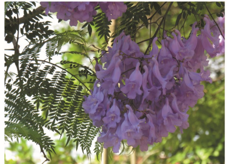
folhas e flores